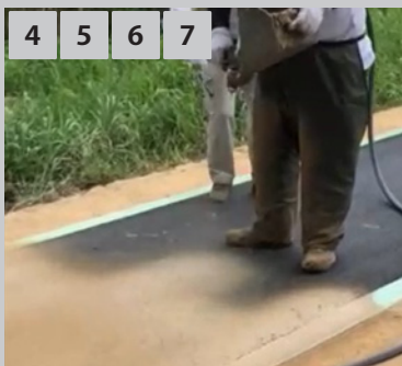
4 5 6 7 吹付 2回に分けて吹き付け、2mm厚に仕上げます。

大掛かりな機械を使わず、アスファルト舗装の表面に手を加えるだけの短時間作業なので、低コストに施工ができます。養生期間が短いので、長期通行止めの必要がありません。