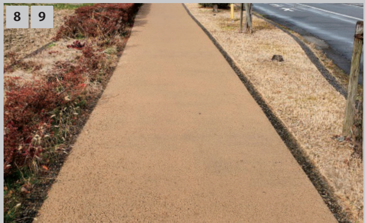
8 9 完成 乾燥後、養生を撤去します。