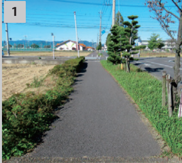
1 洗浄 表面の付着物やほこり等を取り除きます。