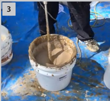
3 攪拌 容器に混和剤→砂の順で入れて攪拌します。