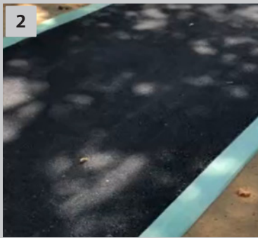
2 養生 吹き付け面の境界線をマスキングします。